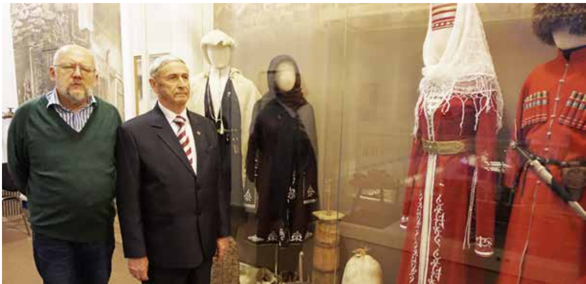
ТыкIва МухIамад (агьымала йгылу) Россия аэтнография музей апны.

Атурых зчIауа ауагIа ракIвпI. Бибарктгьи агIвычIвгIвыс пшдзакIвала йбайата йгIамгIвайстI. Макьар Умари Тобыль Тольыстани рахIа гIарылымIцыргьи ари акыт ахьыз йанакIвызлакIгьи дута йырхIвушын. Арат агIвыджь йапхьахауата ащхьагIвчIва дырра рылазгуз арыпхьагIвчIва дууын.