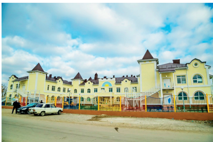
Псыжв кыт асабигІзарта шыц асквш 2016 аглан йглахъыртлытІ.

Уахъчвала Псыжв абаза кытква зымгІва рацкІыс йдупі, ауаъа 9000-гІвы раъара бзазиті. Акыт гІвапхъартакІ, гІвсабигІзартакІ, азъазара апхъарта тагылапІ. Араъа йаныргІалпІ Абаза район аквта айъазартаква, абиблиотека.