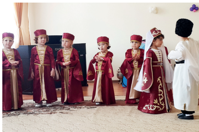
Асабиква йшхвыцыркІву абаза глахІвыщаква йырзырбжытІ.